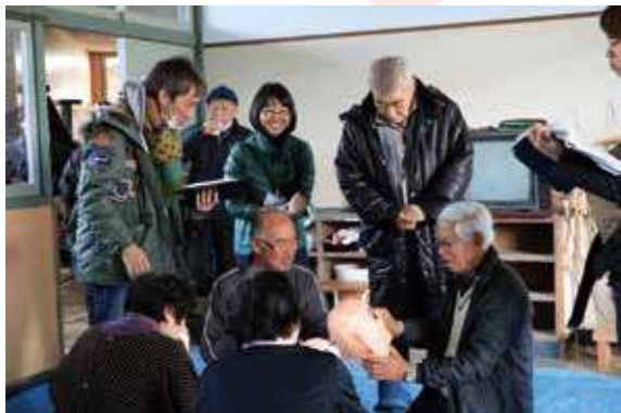
▲宮地岳かかしの里での撮影風景

この映画は19日間、全編天草でロケが敢行されました。ロケ場所の提供や炊き出し、エキストラ出演など地域の人々が全面的に協力してともに作り上げていきました。