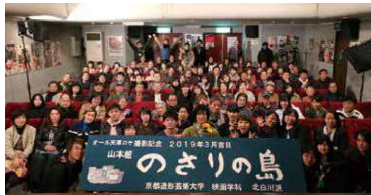
▲本渡第一映劇でエキストラの市民と記念撮影