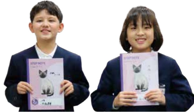
▲企画運営委員で使っているノート