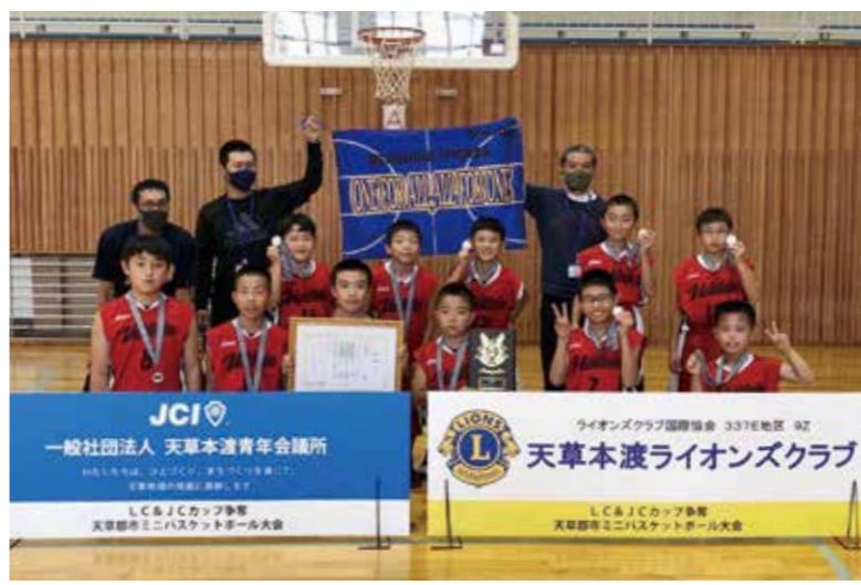
▲みんなで仲良く練習しています!