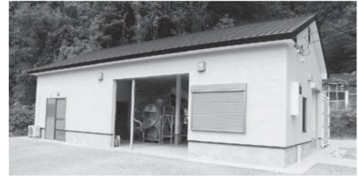
▲完成した有害鳥獣処理施設

内容 教育長および教育委員会委員の任命、人権擁護委員候補者の推薦につき意見を求める議案が提出され、すべて原案どおり同意しました。