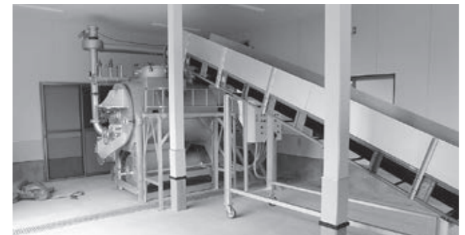
▲イノシシを減容化処理する設備