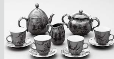
▲須恵焼金錆染付珈琲一揃