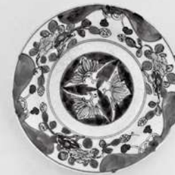
▲高浜焼色絵蝶紋大皿

とき 1月29日④～3月21日④ 午前8時30分～午後5時(入館は午後4時30分まで) ところ 本渡歴史民俗資料館 2階展示室(今釜新町) 展示内容 ・収蔵資料を中心とした天草のやきもの ・天草と関係の深い須恵焼、瀬戸(現愛知県瀬戸市)の加藤民吉の作品(一部パネル)など