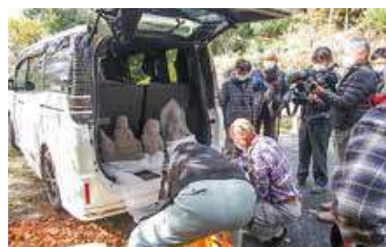
▲令和2年7月豪雨で、お地藏さまがいなくなった相良村へ思いを込めて