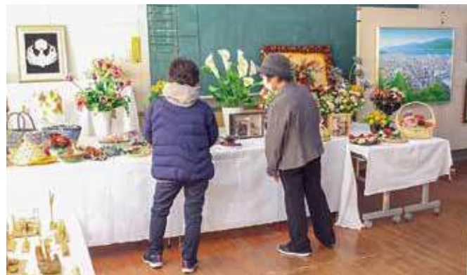
▲たくさんの手作り作品を楽しむ参加者

来場者たちは、色彩鮮やかな絵画などの作品に見入ったり、バザーでお目当ての商品を購入するなど、「どの作品も素晴らしく、楽しめた」と、芸術の秋を満喫していました。