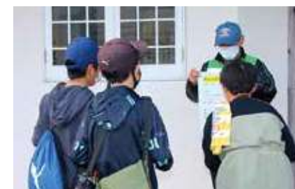
▲参加者が地域の歴史クイズに挑戦！