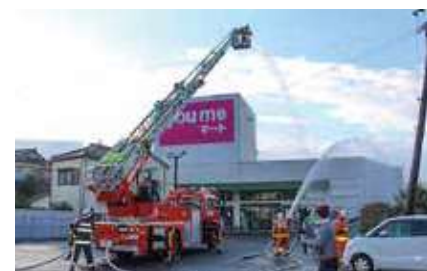
▲消防隊員がはしご車と地上から放水