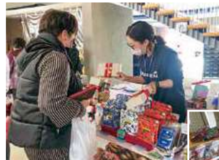
▲障がい者福祉施設が集まり、コーヒーやハンドメイド作品などを販売