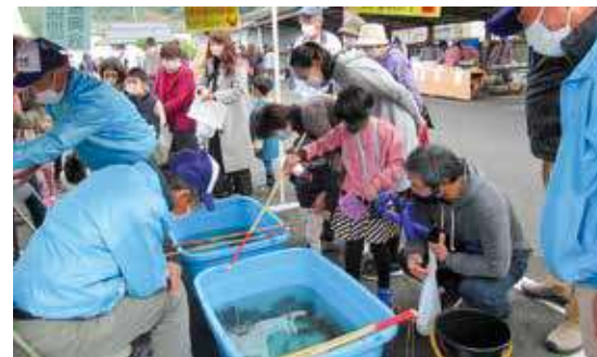
▲祭りの風物詩「ガネ釣り体験」