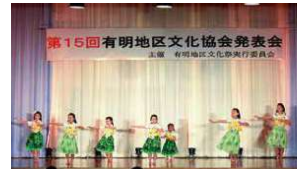
▲舞台発表は8組がフラダンスなどを披露