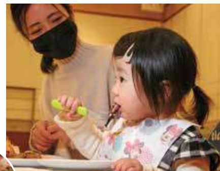
▲天草大王いただきまーす！