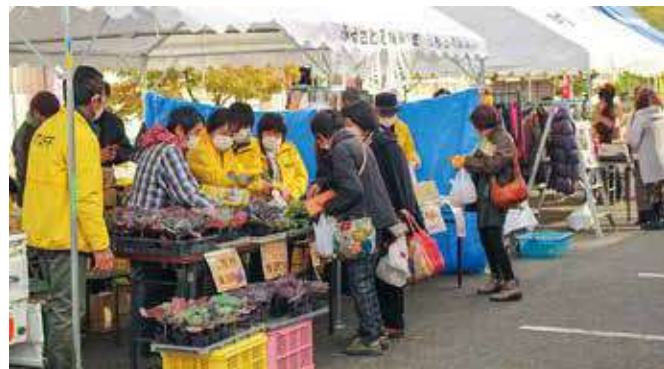
▲花苗やおいしい食べ物などが並んだバザー