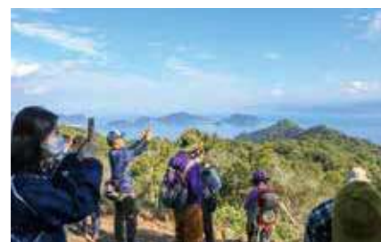
▲美しい眺めを撮影する参加者