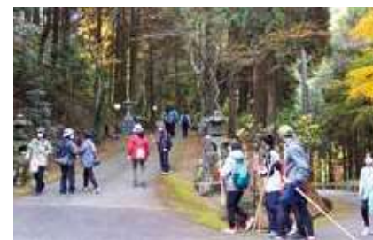
▲森林浴を楽しみながら歩く参加者