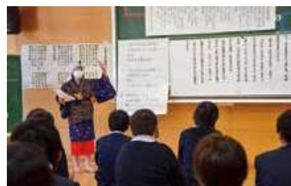
▲保存会が唄の意味などを5・6年生に説明