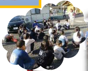
ひなんくんれん じしん 避難訓練(地震)