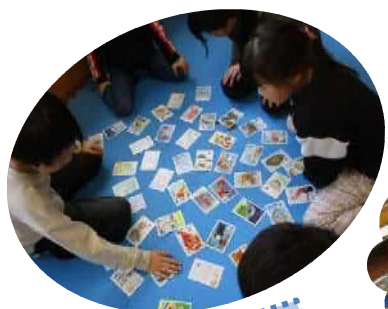
たいかい かるた大会