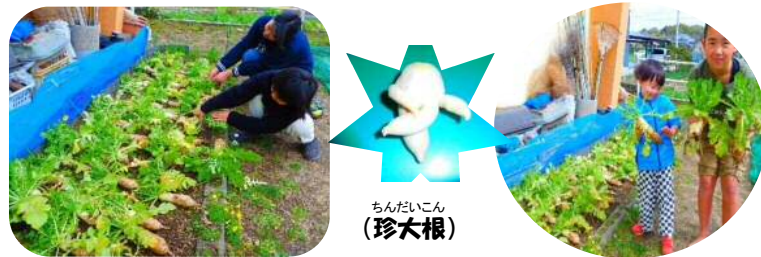
ちんだいこん (珍大根)