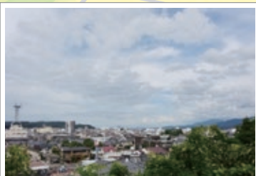
坂の上からの市内の眺め

急な坂道を住宅方面へ登って行くと、市街が一望できます。下りは十万山登山の道に出ます。