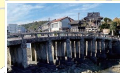
祇園橋 (国指定重要文化財)