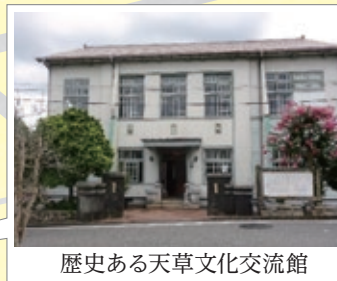
歴史ある天草文化交流館