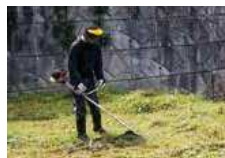
行政区で設置した防犯灯の電気使用料や管理費用 ▼草刈機などを購入

皆さんが納めている区費がどんなことに使われているか知っていますか？ 各行政区によって多少の違いはありますが、防災・防犯対策やごみステーション等の維持管理、清掃活動、イベントなどを開催する費用に使われています。