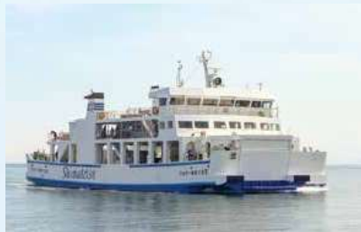
フェリーあまくさII

就航：平成27年 全長：48.35m 全幅：14m 速力：11.50ノット(時速約21km)