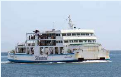
フェリーくちのつ

最近ロードバイクでサイクリングする人が増えているので、自転車を固定できるよう工夫しています。あまくさIIは船内にエレベーターを設置しているため、階段の昇降が難しい人も安心して利用できます。 両フェリーともに船長を含め、乗組員6人が常時乗船しており、長崎・天草在住者がいます。仕事が終わって口之津港に停泊するときは、天草の乗組員は船内で食事や寝泊まりをしています。 天気の良い日に展望デッキから見る雲仙普賢岳は最高です。運が良ければイルカを見ることが出来ます。