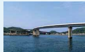
▲海上からしか見られない景色を楽しめます

第二天長丸は船を操縦する操舵室やプロペラが前後にある両頭船で、九州でも数隻しかない珍しい船です。車両などの積み下ろしのために船を反転する必要がないので、停泊時間を短縮して運航できます。 長島海峡は午前と午後で潮の流れが変わるので、同じ航路を走っているように見えて、実は毎回違います。途中に見える戸島を近くで見ることができると、違った景色が楽しめます。八代港へ向かう外国のコンテナ船やクルーズ船を見ることが出来ます。