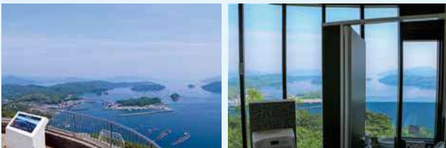
▲トイレからの景色も絶景

展望台からは、眼下に「薩摩松島」の島々が広がり、遠くには御所浦島や、天気の良い日は雲仙普賢岳を見ることができる絶景スポット。「かごしまよかとこ100選」に選ばれています。