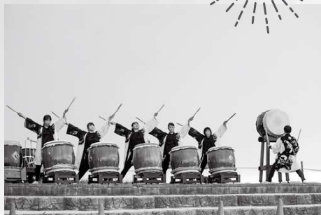
▲天草ありあげ太鼓