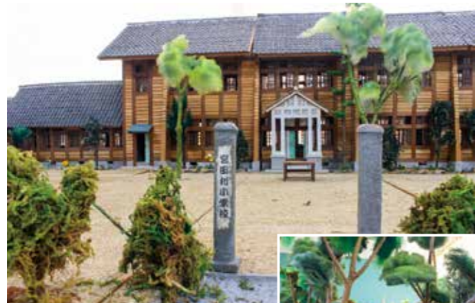
旧宮田小学校の模型 (倉岳町)