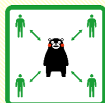
くっつかないモン #KeepDistance

★ ワクチンを受けたあとも、手洗い・消毒・マスクなどの感染予防対策を続けましょう。