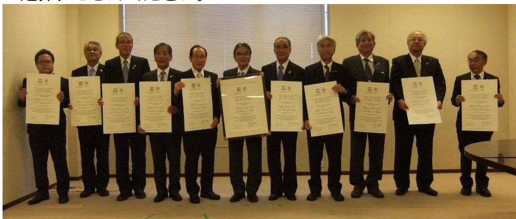
↑【関係自治体集合写真（左から2番目が天草市長）】