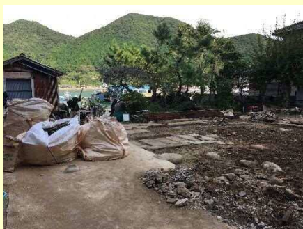
↑【解体が終わったところ】

今は建物の解体が終わり、再利用できる部材の選定を行っているところです。しかし、思っていた以上に傷みが激しく、白アリの被害もありました。これから、関係機関とも協議して部材の調整を進めていきます。調整が済み次第、建て方に入る予定です。