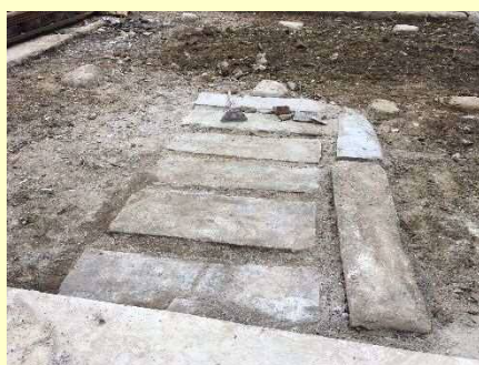
↑【床下から謎の石畳！？（調査中）】