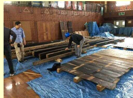
↑【再利用できそうな部材を調査】